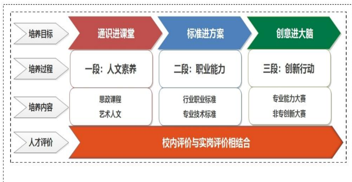
图 1 鞋类设计与工艺专业“三段三进”人才培养模式